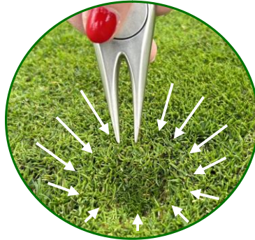
Nach innen drücken und im Kreis arbeiten

Eine Pitchgabel ist empfohlen, aber ein Gerät mit Spitze geht auch z.B. ein langes Holz-Tee