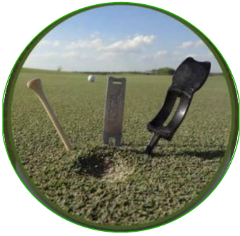
Wähle Dein Werkzeug

Eine Pitchgabel ist empfohlen, aber ein Gerät mit Spitze geht auch z.B. ein langes Holz-Tee